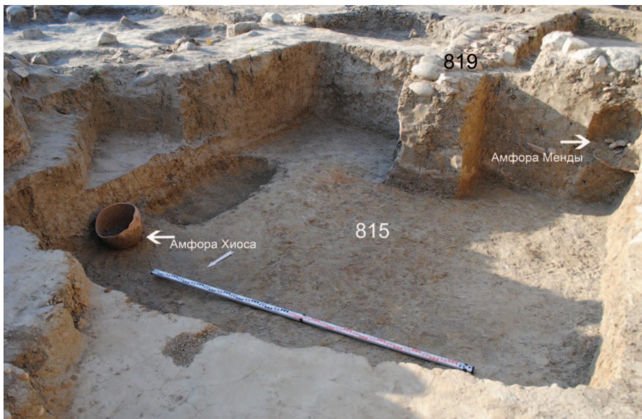
Рис. 2. Котлован 815, места расположения амфор: хиосской в интерьере (северо-восточный угол) и мендейской (юго-западный угол) в засыпи. Вид с С-СЗ