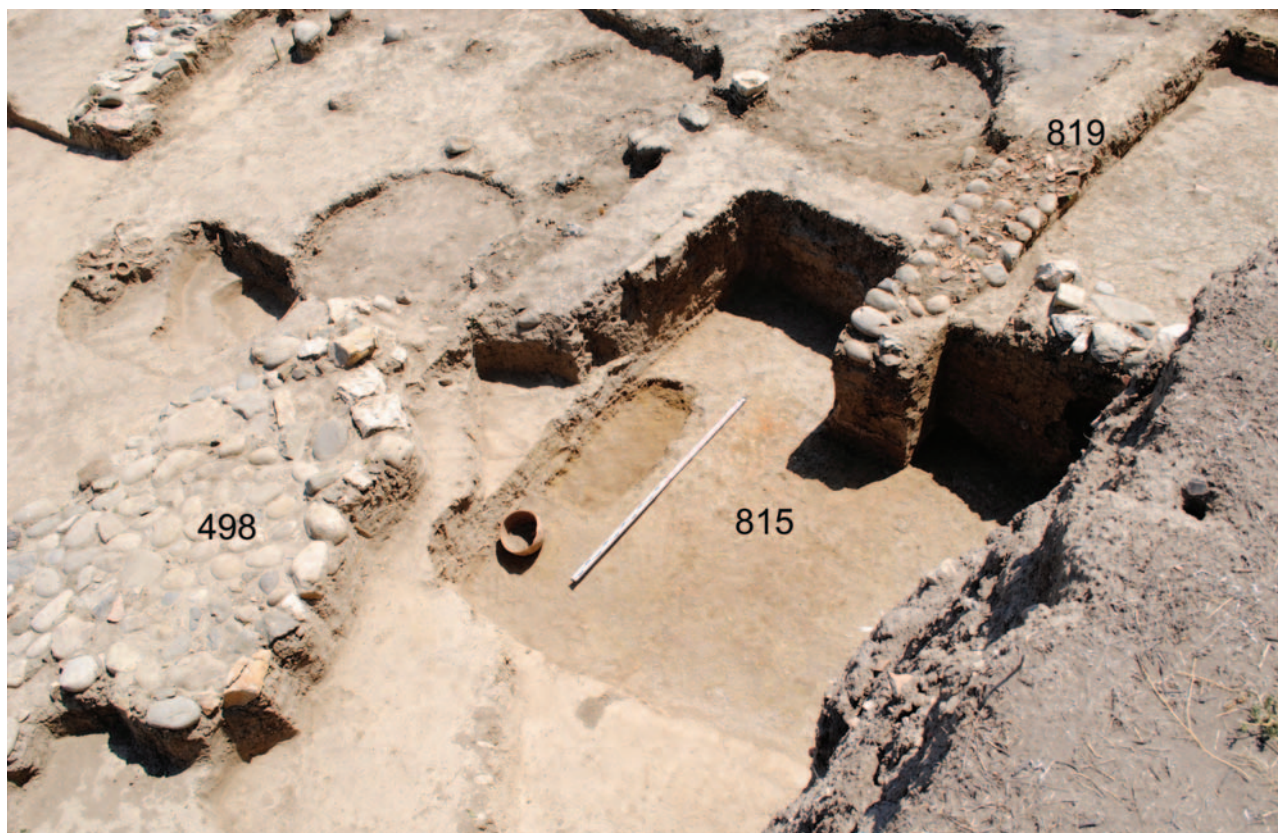
Рис. 1. Объекты 815 и 819. Вид с СЗ