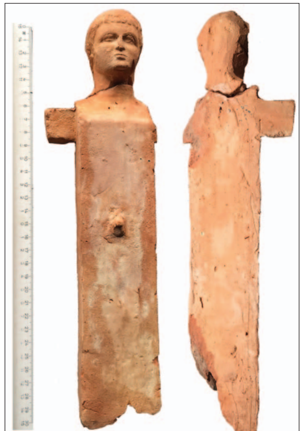
Рис. 1. Герма из Фанагории