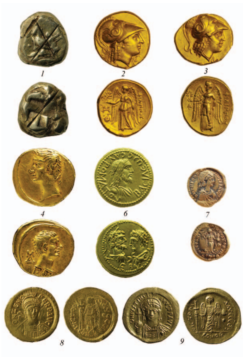
Золотые монеты из Фанагории